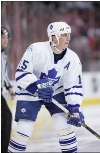
Nähtäväksi jää, kestääkö Kaberien kasetti.